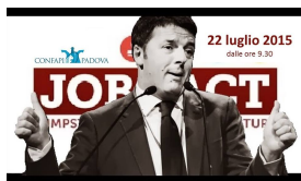
JOBS ACT Come cambia la gestione del rapporto di lavoro Tutte le novità dopo gli ultimi decreti attuativi

22 LUGLIO - SEMINARIO "JOBS ACT" COME CAMBIA LA GESTIONE DEI RAPPORTI DI LAVORO